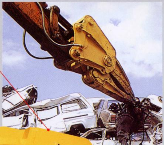
現場作業中の IRON CUTTER

カッター刃の合わせ(スキマ調整)は、シムにより、簡単に調整ができます。また、長時間のハードな作業等でズレがでて、簡単に元の状態に戻せます。