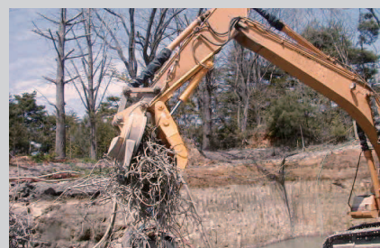
現場作業中のサブフォーク